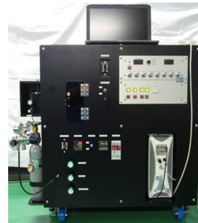
LICA-MS (リアルタイムガス分析装置) 高精度アウトガス測定装置