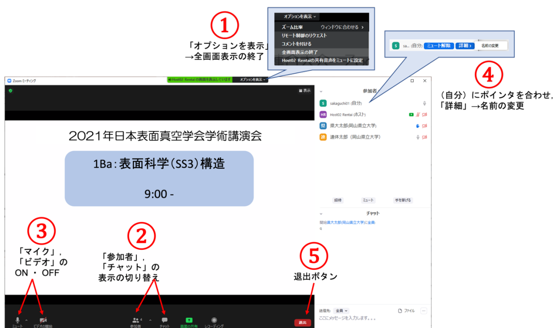
図 2 Zoom 画面の全体図