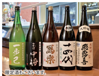
限定酒もございます。