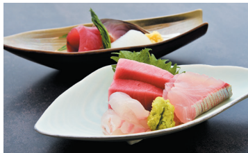
▲おまかせコース(11,000円)のお刺身盛り合せ