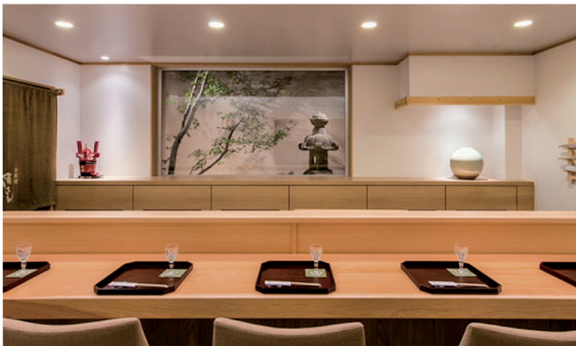
▲カウンター席もございます。

落ち着いた佇まいの中で、四季折々の食材の味わいを引き出し季節の移ろいを感じさせる料理をご堪能ください。