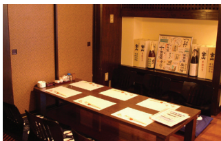
▲お席はカウンターとテーブル席、個室(6~40名)をご用意できます。