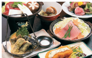
▲郡山の鯉など地物が豊富です。