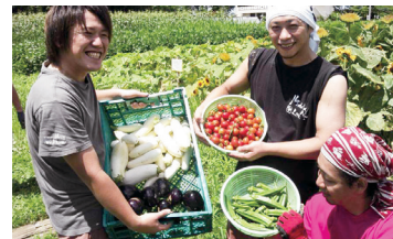
▲郡山の隠れた名産は鯉。居酒屋なら ▲スタッフ自ら作る野菜も人気の一つで、旬ではの鯉料理を提供しております。 の採れたて野菜料理がオススメ。