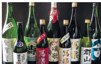
▲福島酒の地酒を多数取り揃えております。