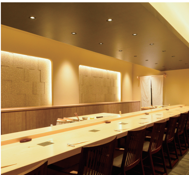
▲白木造りの上質な空間でいただく“握り”。真心をこめたおもてなしも心がけております。