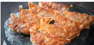
▲焼餃子5種類と、鶏白湯スープの炊き出し餃子は絶品!

名物の「塩もつ煮」「手仕込み餃子」や地物食材の料理が楽しめます。ゆったり個室や賑わうテーブル席、カウンターもございます。