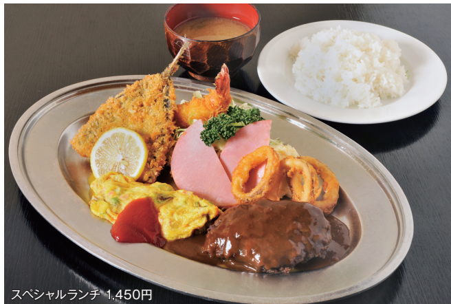
スペシャルランチ 1,450円

料理は和・洋・中華なんと100種類以上が楽しめる大型大衆食堂。その全てがこだわりの味。一人でのんびり、みんなでワイワイ楽しめます。