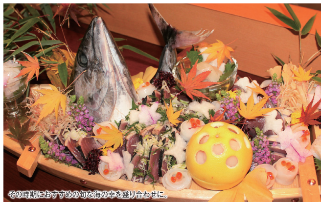
その時期におすすめの旬な海の幸を盛り合わせに。

日本酒も限定酒有! بون酢、刺身しょうゆも手作り。できる限り県産食材をつかい、お肉は麓山高原豚をはじめブランド肉。個室もございます。