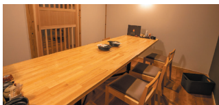
▲完全個室7室、4~8名様まで人数に合わせてご用意可能