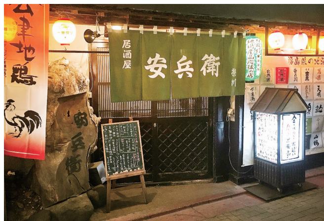
▲郡山駅西口から歩いて5分、緑提灯と地酒ラベルがずらりと並んだ入口が目印。

創業42年。趣きある店内は演歌が流れ昭和の雰囲気。地もの食材や地酒が豊富な地域密着の居酒屋です。