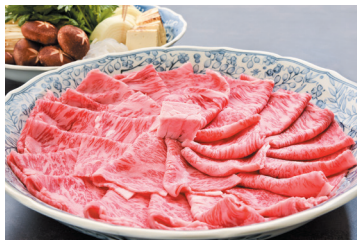
▲うねめ牛のすき焼き 1人前(4,800円)