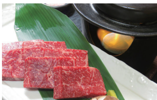
▲福島黒毛和牛石焼